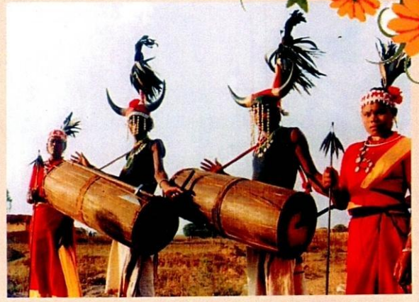
आदिवासी नृत्य (बस्तर)