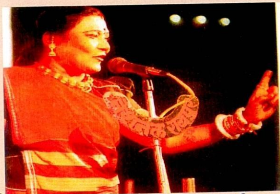
तीजन बाई (पंडवानी गायिका)